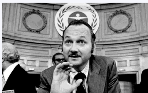
Maurice Strong 1976-ban

- A klímamodellek hibája nem vélemény kérdés, hanem tény. A tudományban a modell és a valóság tartós eltérése esetén a hibás modellt eredményező hipotézist elvetik. Nem így a klímapolitikában, ahol a valóságot igyekeznek a klímamodellhez igazítani. A kőkemény gazdasági és világhatalmi érdek a teljes környezettudományt szétzilálta. Ha egyetlen felelőst kell megneveznem, akkor Maurice Strong kanadai üzletember és világszélhámos nevét említem. Lényegében ő találta ki a környezeti mozgalmakat, a klímapolitikát és mindezek globalizálását.