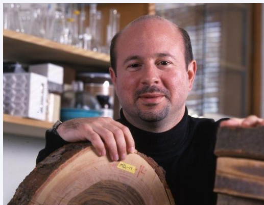
Michael Mann - citizensclimatelobby.org

- Az áltudósok vezéreit (valamint a kutatásfinanszírozás globális rendszerét és a tudományos szervezetekben sok kulcspozíciót betöltő elfogult vezetőket) leszámítva nincs baj a kutatókkal. A tudományos vita mindenkinek izgalmas kihívás, amennyiben hagyják azt lefolyni. Úgy vélem, hogy a legtöbb kutató saját szűk szakterületén kiválóan eligazodik, de nem látja át a szélesebb összefüggéseket. Lehet, hogy sokan nem is akarják látni a szennyes oldalt, de többségükben inkább hiszékenyek, illetve jóindulatúan azt feltételezik, hogy a kutatási eredményekből készített vezetői összefoglalók szerzői is betartják a tudományosság hármass követelmény-rendszerét (tapasztalatiság, tárgyyszerűség, ésszerűség). Még Michael Mann, a középkori meleg időszakot utólag eltüntetni igyekvő „hokibot-görbe” kiagyalója is elcsúszott egy olyan banánhéjon, hogy nem tudta bemutatni az állításait alátámasztó adatokat és módszereket.