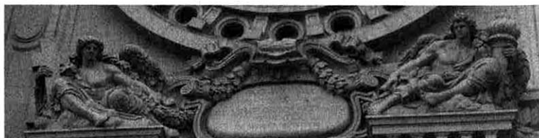
A hit kereszte és a tudomány fátklyája egy templomkapu fölött

Tartsuk magunkat távol az újabban egyre gyakrabban fellángoló evolúció kontra kreacionizmus vitától, és különösen vigyázzunk, hogy vallásos meggyőződésünket a tudomány világában ne kényszerítsük rá másokra. Ne a tudomány legyen missziós terepünk!